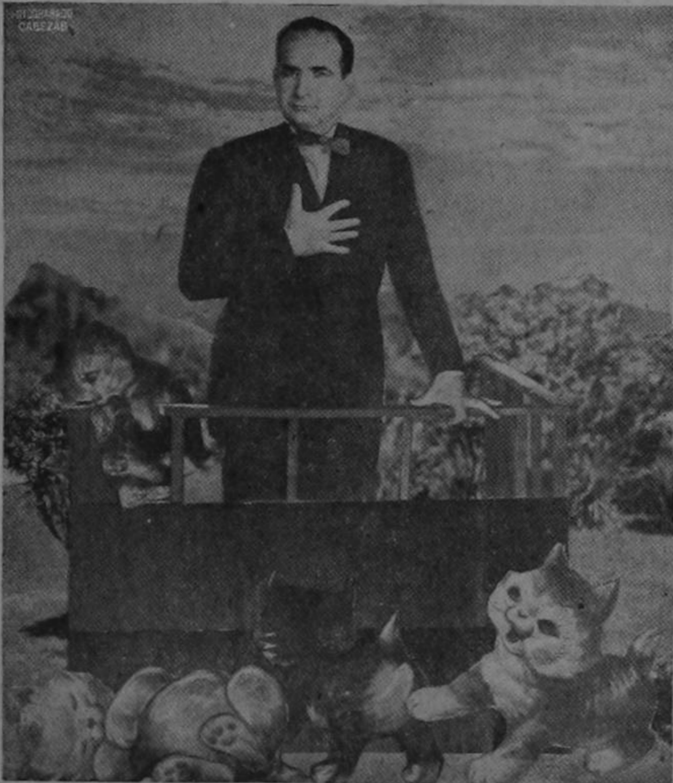
—"Gracias, amado pueblo, muchas gracias..."