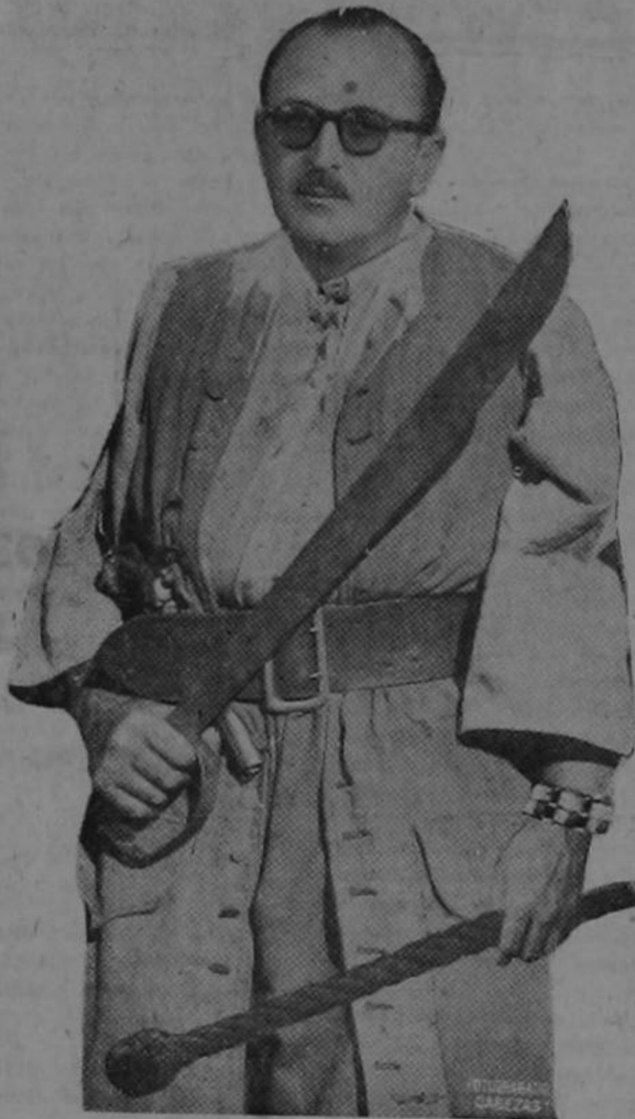
Lo dicen varias personas y ya lo sabe la gente,